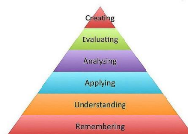
Gambar 1. Taksonomi Bloom

High Order Thinking Skills (HOTS) merupakan kemampuan kognitif yang vital di abad ke-21, menuntut pelajar untuk memproses informasi jauh melampaui hafalan dan pemahaman dasar. Konsep ini berakar kuat pada revisi Taksonomi Bloom, di mana HOTS mencakup tiga tingkatan kognitif tertinggi: Menganalisis (C4), Mengevaluasi (C5), dan Mencipta (C6) (Anderson & Krathwohl, 2001). Inti dari HOTS adalah mengembangkan keterampilan berpikir kritis, kreatif, dan logis yang diperlukan untuk membuat keputusan yang tepat, menyusun argumen yang kuat, dan memecahkan masalah kompleks yang tidak terstruktur.